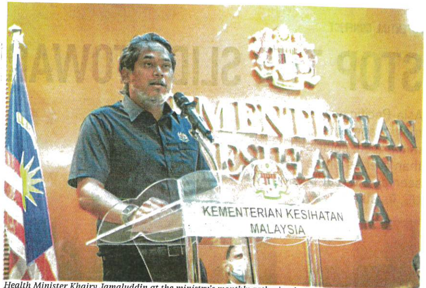
Health Minister Khairy Jamaluddin at the ministry's monthly gathering in Putrajaya yesterday.

"The government should also continue its efforts to make the MySejahtera app a public health management tool, in line with plans to digitalise the country's healthcare services."