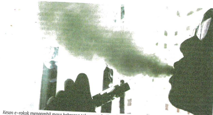
Kesan e-rokok mengambil masa beberapa tahun untuk dikenal pasti.

"Produk NRT ini boleh diperoleh dalam beberapa bentuk antaranya gum yang berfungsi menyerap sebahagian nikotin dan