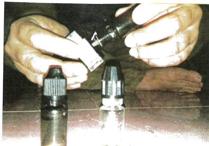
It will take years to discover the long-term effects of e-cigarette use. FILE PIC

Dr Haniki said the inclusion of e-cigarettes in the Control of Tobacco Product and Smoking Bill 2022 was not a step backwards, but a move to